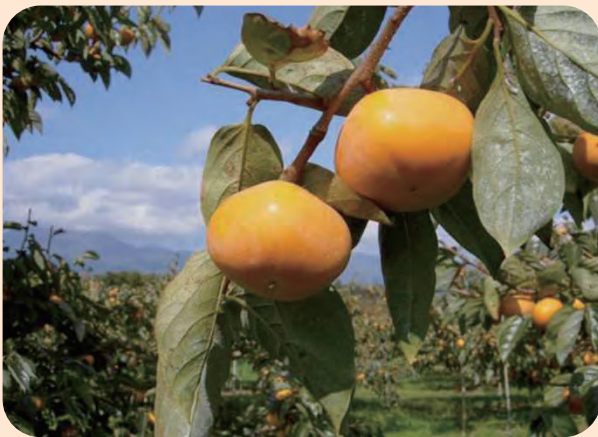
佐渡島特産「おけさ柿」