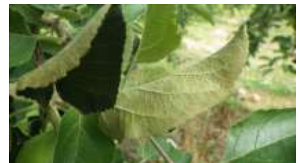
図 2 リンゴサビダニによる葉裏の褐変