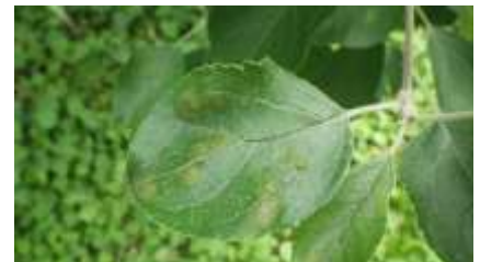
写真 1 黒星病の罹病葉