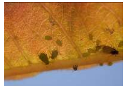
図4 なしに寄生するワタアブラムシ