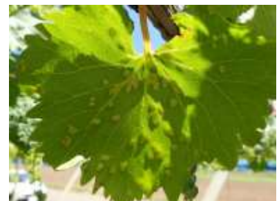
図5 ブドウハモグリダニの被害葉